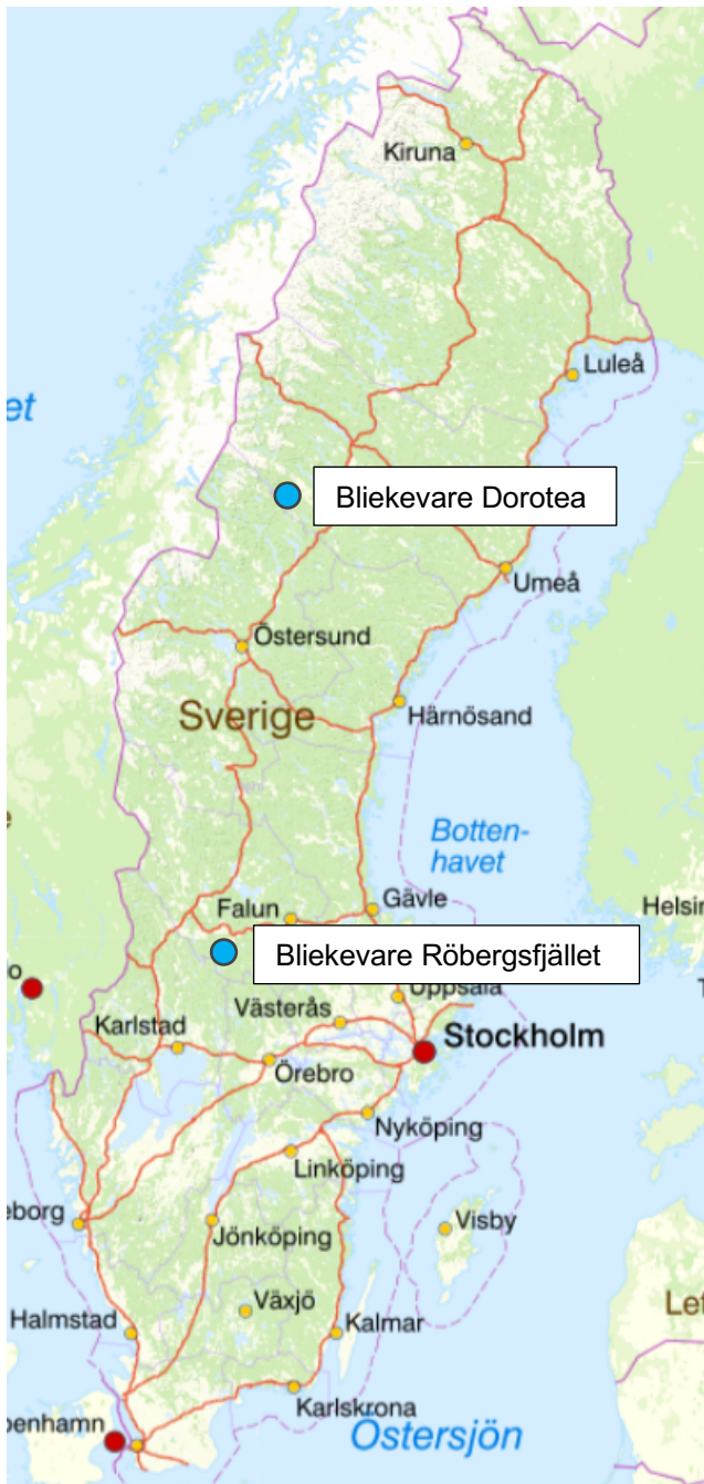
Figur 3. Karta över elnätets geografiska lokalisering.